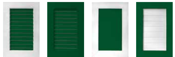
Schräglamellen Füllung Dekor