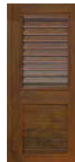
Kombination geschlossene und Schräglamellen, nur mit Querriegel